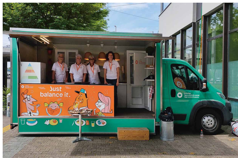
Der Ernährungsbus stand vor dem Hallenbad bereit.