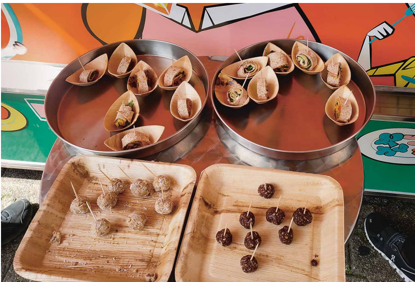
Wraps, Energyballs und Hafermilch wurden angeboten.

Vom 10. bis 12. Mai 2022 fand der diesjährige Eat-Fit-Event statt. Dieses Jahr wurde er von der Präventions- und Gesundheitskommission (PGK), von der Krebsliga und dem SV Restaurant gemeinsam organisiert.