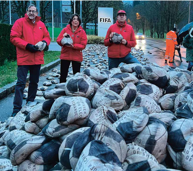
Protestaktion gegen die Arbeitsbedingungen in Katar vor dem FIFA-Hauptsitz in Zürich. 6500 Bälle als Mahnmahl für viele Tausend gestorbene Arbeiter.

In rund zwei Monaten wird die Fussball-Weltmeisterschaft in Katar eröffnet. Gespielt wird vom 21. November bis zum 18. Dezember 2022. Damit finden die Spiele nach 21 Austragungen zum ersten Mal in einem muslimischen Land statt. Für die ausgelassenen Fussballfans vor Ort wird vieles nicht so sein wie üblich. Der Konsum von alkoholischen Getränken und ausschweifende sexuelle Aktivitäten sind strikt zu unterlassen und können mit einer langen Haftstrafe sanktioniert werden. Für die Fussballfans in der Schweiz ist die grösste Umstellung, dass die WM-Spiele im Public Viewing nicht mit Bier, Bratwurst und Badehosen genossen werden dürften, sondern mit Glühwein, Fondue und Wintermütze.