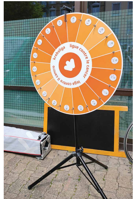
Am Glücksrad gab es eine Preisvergünstigung im SV Restaurant oder Hafermilch zu gewinnen.

Der Präventionsanlass war für die Lernenden und sämtliche Mitarbeitenden der Wirtschaftsschule KV Zürich konzipiert. An allen drei Tagen stand von 9:00 bis 15:30 Uhr der Ernährungsbus der Krebsliga draussen vor dem Hallenbad. Wraps, Energyballs und Hafermilch wurden zur Degustation angeboten. Rezepte von gesunden Mahlzeiten und diverse Tipps für eine vollwertige Ernährung konnten bei den Vertreterinnen der Krebsliga eingeholt werden.