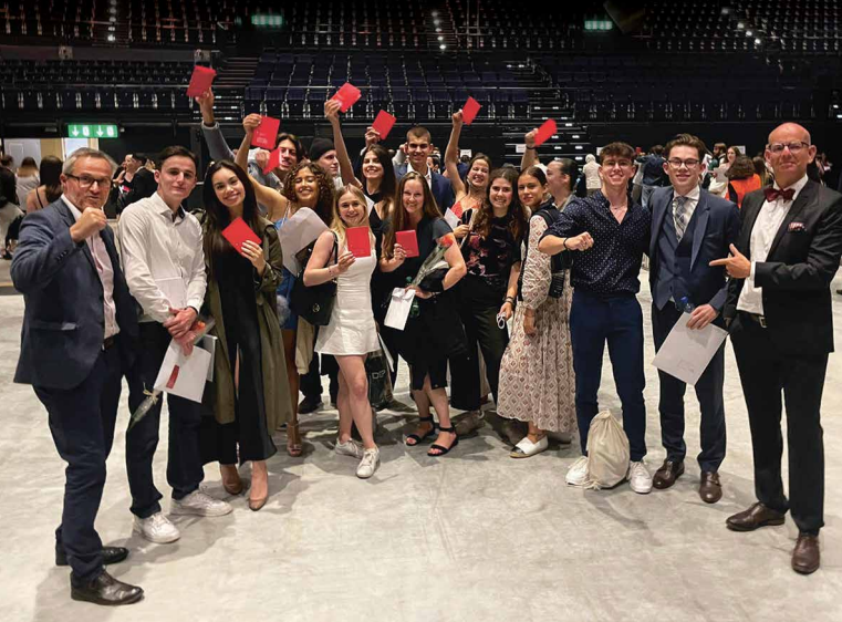
Die Bili-Klasse 21-E1.60 an der Abschlussfeier